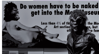
Guerrilla Girls, V & A Museum